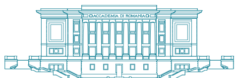
ACCADEMIA DI ROMANIA IN ROMA